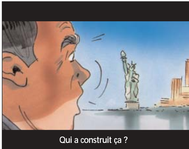
Qui a construit ça ?