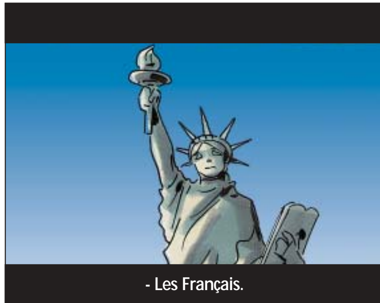
- Les Français.