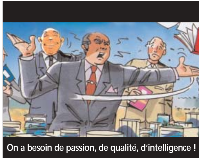
On a besoin de passion, de qualité, d'intelligence !